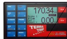
Tripmaster nicht rein mechanisch