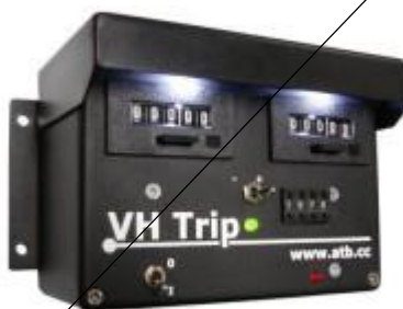
Tripmaster nicht rein mechanisch