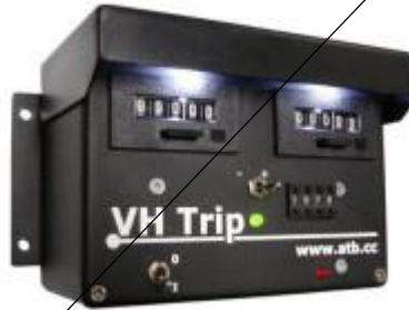
Tripmaster nicht rein mechanisch Schnittcomputer