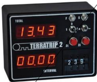
Tripmaster nicht rein mechanisch