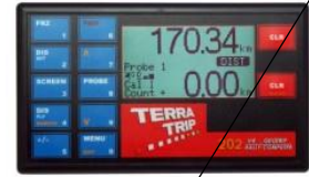
Tripmaster nicht rein mechanisch