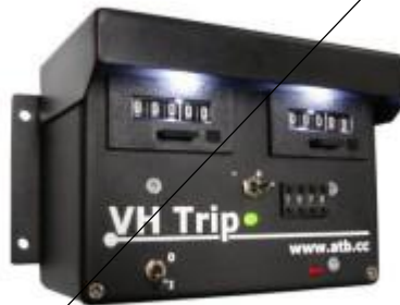
Tripmaster nicht rein mechanisch