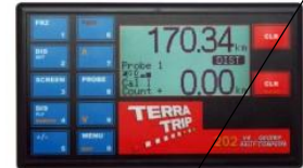
Tripmaster nicht rein mechanisch